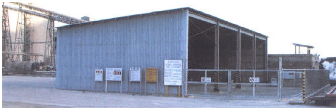
그림 2에 잘 정돈된 본공장 지정 폐기물 보관시설을 나타내었다.

또한 철저한 폐기물 관리를 위하여 본공장 및 항만에 지정폐기물 보관장 (1식) 과 일반폐기물 보관장 (2식)을 보관장 기준에 맞게 설치하여 운영하고 있다.